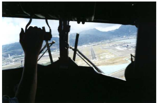
Abbildung 3: Die Landebahn aus dem Cockpit

Aber die Landung, oh weh! Nachdem auf den hawaiianischen Inseln stets ein frischer warmer Wind weht, schaukelte das kleine Ding recht arg hin und her und der Pilot – wie wir live mitverfolgen konnten – ruderte ganz schön an seinen Hebeln, um die Kiste irgendwie wieder sicher auf den Boden runterzubringen. Wie in einem Flugsimulator mit Günter Speckhofer am Steuer wippte die Landebahn im Frontfenster wild hin und her, schließlich kam der Kasten heile runter.