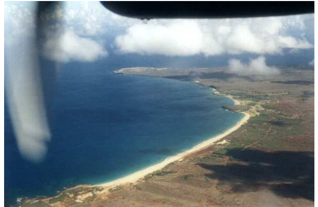
Abbildung 2: Propeller und hawaiianische Insel