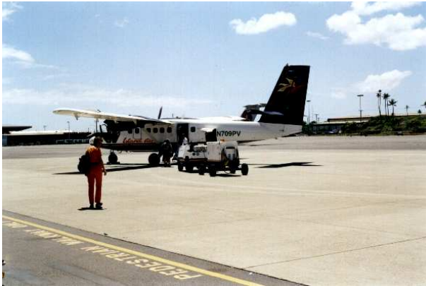
Abbildung 1: Das Flugzeug nach Molokai