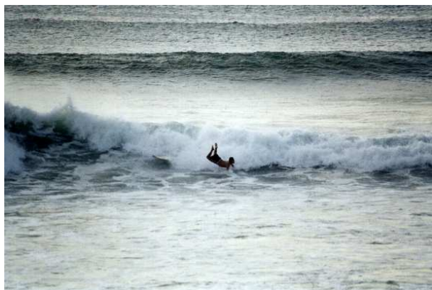
Abbildung 4: Den Einheimischen schmeißt's vom Brett, harhar!